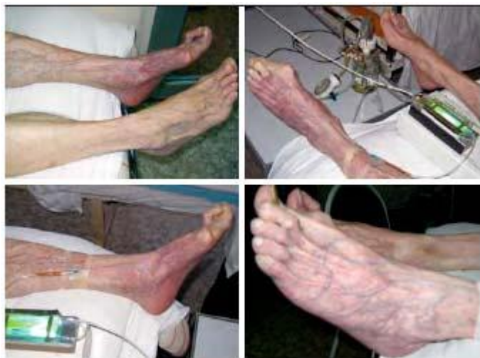
Стопа после реконструкции НПА Стопа после РВОП через 2 часа

сочетает в себе моделирование ретроградной внутривенной анестезии, разгрузочное артерио–венное шунтирование и локальное введение реологически активных препаратов в конечность.